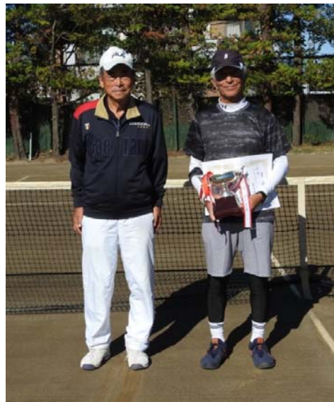
75歳以上シングルス